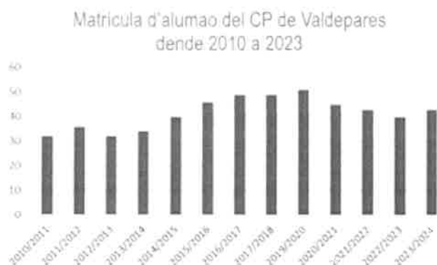
Gráfica 1. Número de matriculas d'alumnao de 2010 a 2023

Tanto el AMPA, como as entidades, organizacióis y personas firmantes del presente manifiesto; cremos qu'este dato, al alcance del administración pública, debería ser motivo de reconocemento al propio centro. Inda llonxe d'esperar el nomao reconocemento, debera ser, a lo menos, motivo pra manter a dotación presupostaria y de personal de forma estable nel presente curso escolar y REVERTIR Y RESTAURAR ESTA DECISIÓN DE SUPRIMIR ÚA UNIDÁ QU'OBLIGA AGRUPAR AL ALUMNAO DE PRIMARIA EN DÚAS AULAS: úa pra 1º, 2º y 3º de primaria y outra pra 4º, 5º y 6º de primaria.